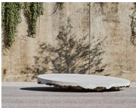
« Circulateur » de Inch Furniture

Constance Chaix, chargée de communication PLATEFORME 10 constance.chaix@vd.ch , +41 21 316 14 60